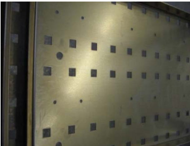
Produktionsteil nach der Nanovorbehandlung

Die Eisenphosphatierung ist ein Standardverfahren zum Aufbringen einer Konversionsschicht vor dem anschließenden Lackieren. Sie erhöht die Haftung und den Korrosionsschutz im Vergleich zu nur gewaschenen Oberflächen. Eine weitere Steigerung der Qualität bringt die Zinkphosphatierung. Sie hat allerdings Nachteile: schwermetallhaltig, aufwändig in der Führung und starke Schlammbildung. Im Gegensatz dazu erlaubt die Nanokeramik mit geringem Aufwand und umweltfreundlich (schwermetallfrei) die Erzeugung von Konversionsschichten auf Stahl, Aluminium und Zink mit nur einer Badeinstellung, welche dem Korrosionsschutz einer Zinkphosphatierung nahe kommt.